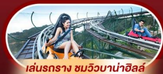
เล่นรถราง ชมวิวบาน่าฮิลล์