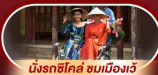
นั่งรถซิคัล ชมเมืองเว้